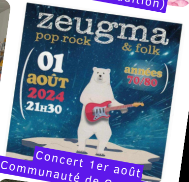
zeugma pop rock & folk 01 août 2024 21h30 années 70/80 Concert 1er août (Communauté de Communes)