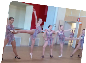
Fête des 10 ans 29 sept. (Loisir et Tradition)