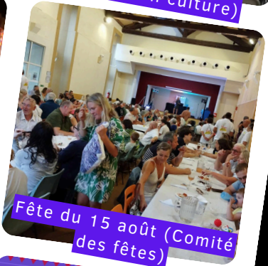
Fête du 15 août (Comité des fêtes)