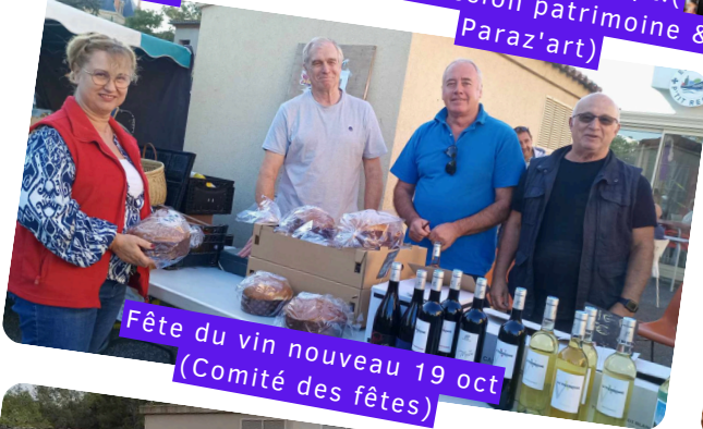
Fête du vin nouveau 19 oct (Comité des fêtes)