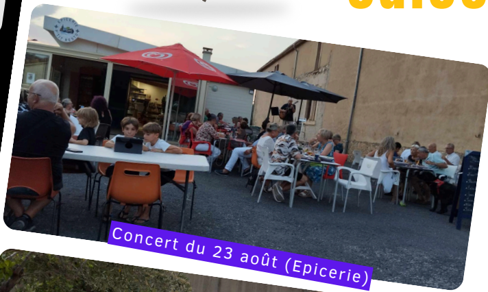
Concert du 23 août (Epicerie)