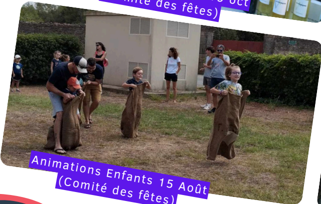
Animations Enfants 15 Août (Comité des fêtes)