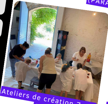
Ateliers de création 7 oct (CLAP)