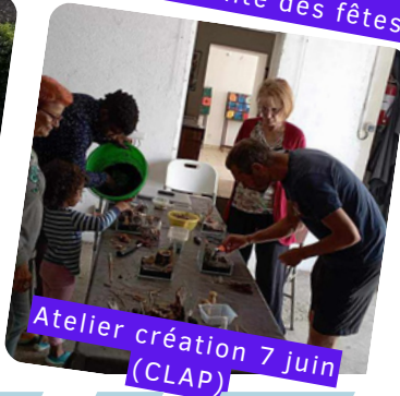
Atelier création 7 juin (CLAP)