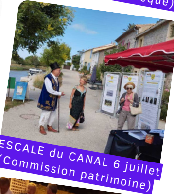
ESCALE du CANAL 6 juillet (Commission patrimoine)