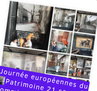
Journée européennes du Patrimoine 21 sept. (Commission patrimoine & Paraz'art)