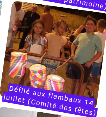
Défilé aux flambaux 14 juillet (Comité des fêtes)