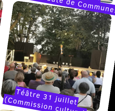
Téâtre 31 juillet (Commission culture)