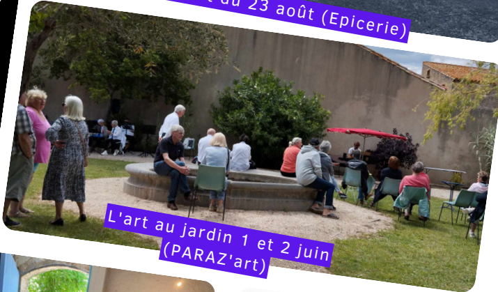
L'art au jardin 1 et 2 juin (PARAZ'art)