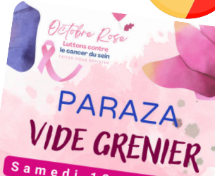
PARAZA VIDE GRENIER Samedi 12 OCTOBRE A partir de 8h00 Le vide grenier 12 oct (Loisir et Tradition)