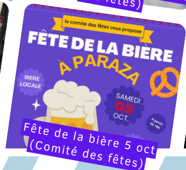
le comité des fêtes vous propose FÊTE DE LA BIÈRE A PARAZA BIÈRE LOCALE SAMEDI 05 OCT. Fête de la bière 5 oct (Comité des fêtes)