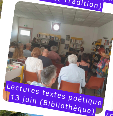
Lectures textes poétique 13 juin (Bibliothèque)